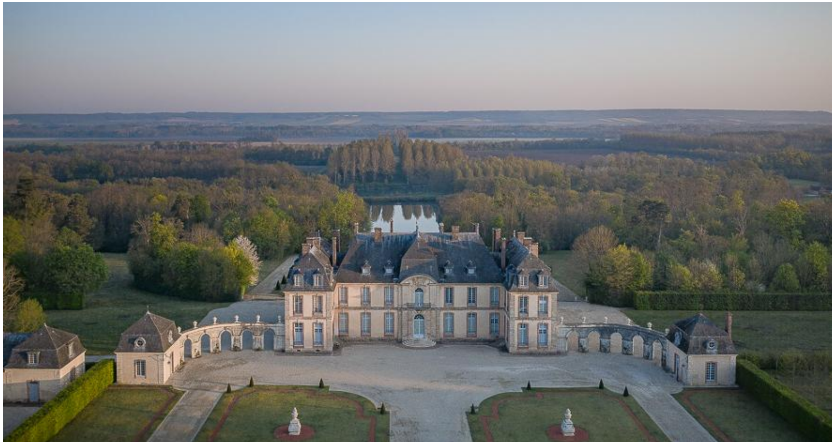
Festival d'été de La Motte Tilly