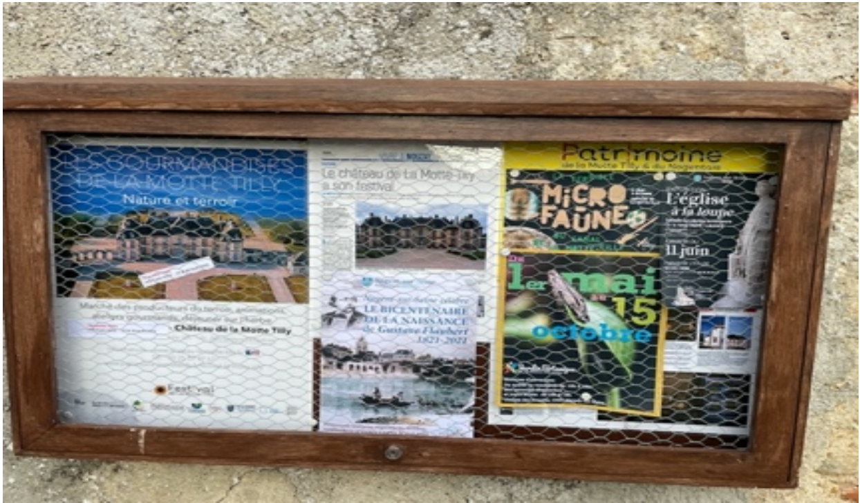
Tableau d'affichage associatif à La Motte Tilly

Ce tableau est ouvert à l'affichage de toutes les associations du Nogentais. Idéalement positionné au carrefour des deux axes principaux de La Motte et en face de l'église. Il annonce nos actions, celles du château, des amis du château, de l'Office du Tourisme et des communes du Nogentais.